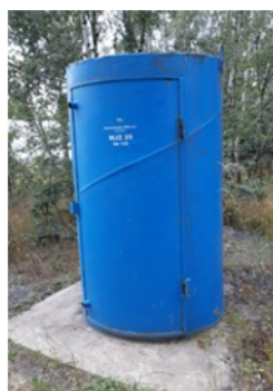
Obrázek 2 Ocelový kontejner nad vrtem

V obou dobývacích prostorech, provozovaných společnostmi Severočeské doly a.s. , bylo nutno ještě donedávna provádět na většině lokalit měření hladin čistě manuálně pomocí metru s indikátorem hladiny.