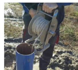
Obrázek 1 Manuální měření hladiny

Pouze na několika málo lokalitách (vrtech) byla hladina měřena automaticky se zápisem do lokálního digitálního zápisníku. Měření však vyžadovalo častou obsluhu s výměnou baterií a načtení dat na místě. Nad vrtem musel stát rozměrný ocelový ochranný kontejner, ve kterém byla umístěna měřicí ústředna a akumulátorová baterie. Postavení kontejneru a pořízení ústředny bylo finančně nákladnou záležitostí, vybitá akumulátorová baterie střední velikosti se musela měnit za nabitou přibližně každé 2-4 měsíce. Některé ústředny měly sice GSM komunikátor, ale ten neměl na většině lokalit dostupný signál a data se tak načítala až na místě připojením notebooku k měřicí ústředně.