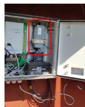
Obrázek 3 Měřicí ústředna s připojením na SENSECOM-GL1 IoT komunikátor

jedna baterie velikosti malého monočlánu (velikost C). Minimalizace rozměrů celého zařízení umožňuje jeho umístění přímo do zhlaví vrtu, na jehož krytu se zároveň instaluje kloboučková anténa. Odpadá tak nutnost budovat nákladný domek kolem vrtu a investovat do měřicí ústředny. Zjednodušila se také údržba. Zařízení je schopno běžet bez výměny baterie 30x déle, tj. více než 5 let. Výsledky měření jsou zasílány dvakrát denně prostřednictvím