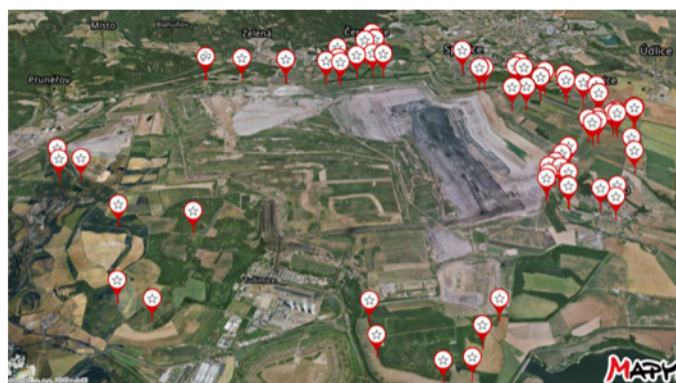
Obrázek 7 Monitoring hladin spodních vod (a pórových tlaků hornin) na jednom z areálů Severočeských dolů a.s.

Díky zařízením řady SENSECOM-HP dnes získává tým specialistů hydrogeologie Severočeských dolů a.s. denně hodnoty o výšce hladiny, případně pórových tlaků oddělených vrstev hornin, z více než 200 vrtů v oblasti hnědouhelných lomů Libouš a Bílina, a to s minimálními provozními náklady.