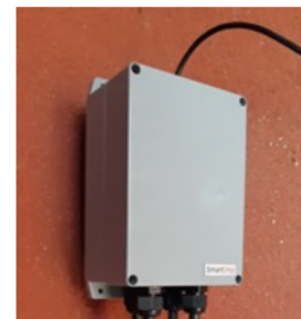
Obrázek 5 SENSECOM-HPC pro měření z až 5 VW sond a odesílání dat přes IoT síť

Postupně tak bylo v následujících 2 letech osazeno po 100 vrtech v každém dobývacím prostoru jedno-kanálovými nebo multi-kanálovými zařízeními.