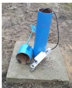
Obrázek 4 Měření hladiny s VW sondou a s odesláním dat pomocí SENSECOM-HP1